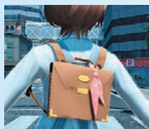
サッチェルバッグM[Ou]