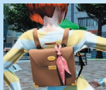
サッチェルバッグF[Ou]