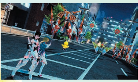
◀▲EP4の主要キャラクターたちに加え、リナやアイカも登場。閃機種を相手に奮闘する。