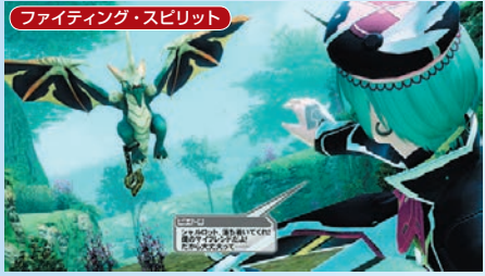
ファイティング・スピリット