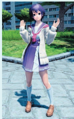
セーラーカーディガン