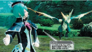
◀▲緊迫するメインストーリーとは裏腹に、サブストーリーではビエトロとシャルロット(レドラン)のドタバタ劇が展開される。