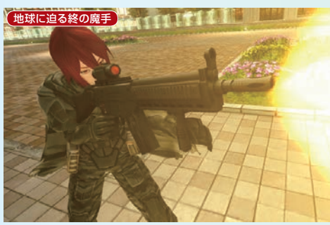
地球に迫る終の魔手

惑星ハルコタンでの戦いが一段落したと思いきや、戦いは次の舞台へと続く。メインストーリーの4章では、オラクルとは別の次元にある地球に閃機種が出現。アースガイドやマザー・クラスタがその対応に当たる。地球のピンチにアークスはどう動くのか、気になる内容は自分の目で確かめてほしい。