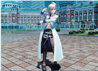
亞悪業制服F[Ou][In] / 亞悪業制服FA[Ba]