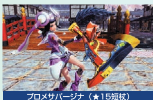
▲おとぎ話をモチーフにしたデザインで、斧のような形状をしている。

季節緊急クエストに合わせて武器とエッグのシートが配信。内容に大きな変更はないが、エッグのシートでは「固い白グミ」や「テクスピッキー」が入手可能。また、SPコレクションに★15短杖の「プロメサバージナ」が追加される。